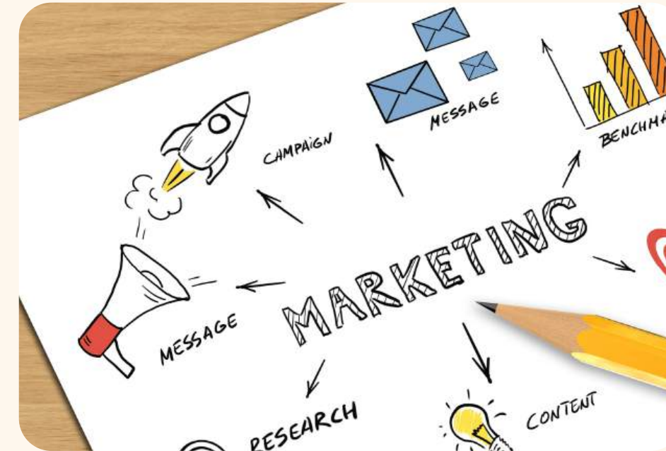
MARKETING E IDENTIDAD VISUAL (MARCA, LOGOTIPO Y COMUNICACIÓN EFECTIVA)