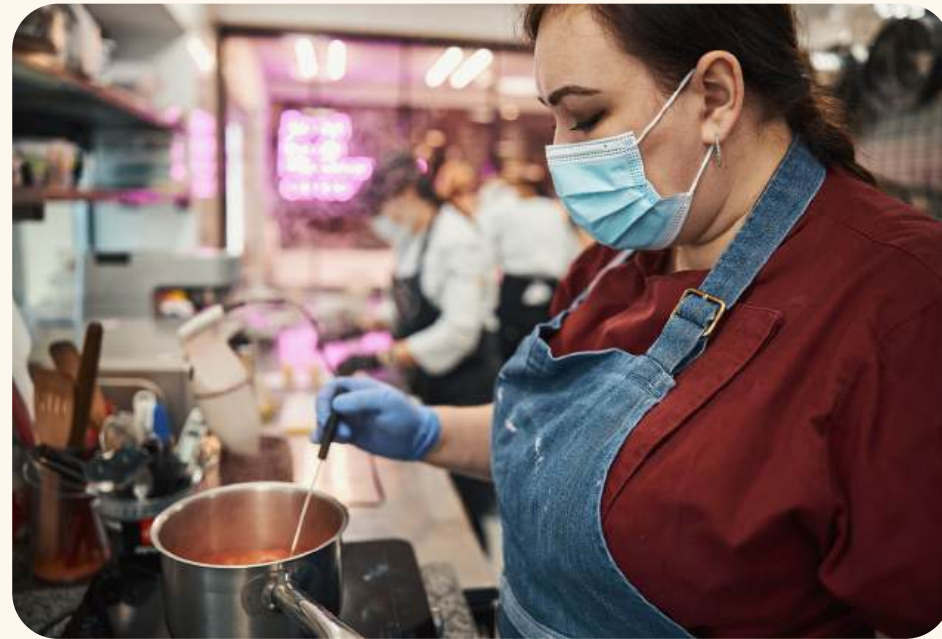
CHARLA BUENAS PRÁCTICAS EN EL MANEJO DE ALIMENTOS

Participar en estos talleres les permitirá aplicar lo aprendido y presentar un proyecto con mayor impacto.